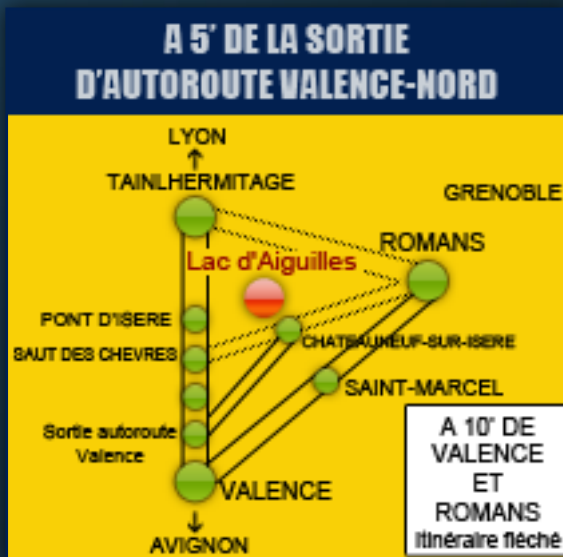
Plan d'accès au Lac d'Aiguille, Châteauneuf sur Isère.

Direction de la communication e-mail : defi-tri@live.fr